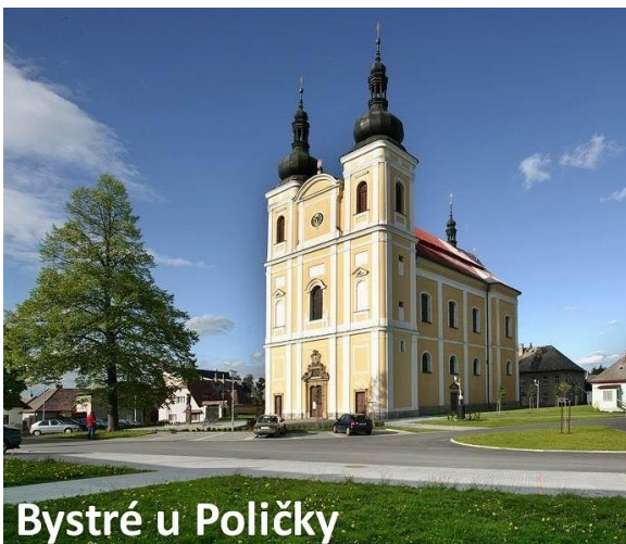
Bystré u Poličky